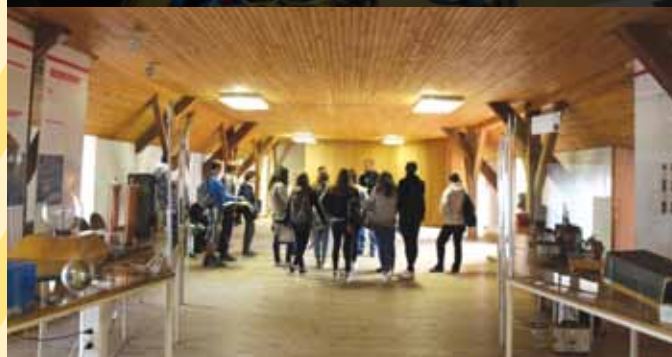
Prikaz poskusov Nikole Tesle v Tehniškem muzeju Slovenije v Bistri