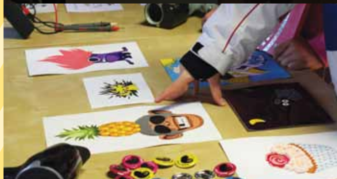
DiZiT v Muzeju pošte in telekomunikacij v Polhovem Gradcu