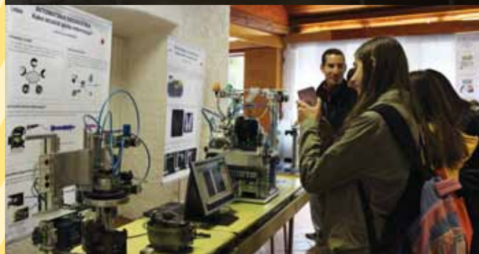
DiZiT v Tehniškem muzeju Slovenije v Bistri