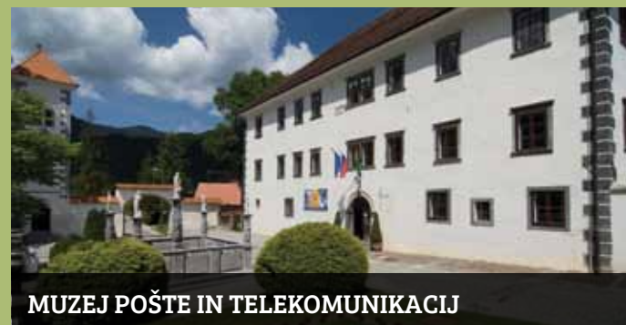
MUZEJ POŠTE IN TELEKOMUNIKACIJ

V zimskem času možen ogled za skupine z muzejskim vodičem.