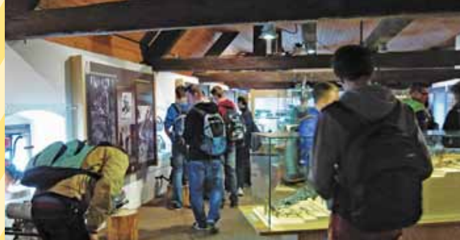
Vodeni ogled v Tehniškem muzeju Slovenije v Bistri