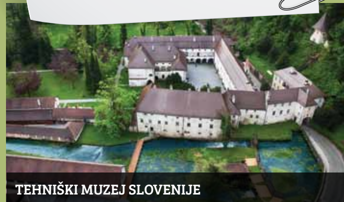
TEHNIŠKI MUZEJ SLOVENIJE

Bistra 6, 1353 Borovnica T: 01 750 66 72, M: 041 957 146, E: programi@tms.si , www.tms.si