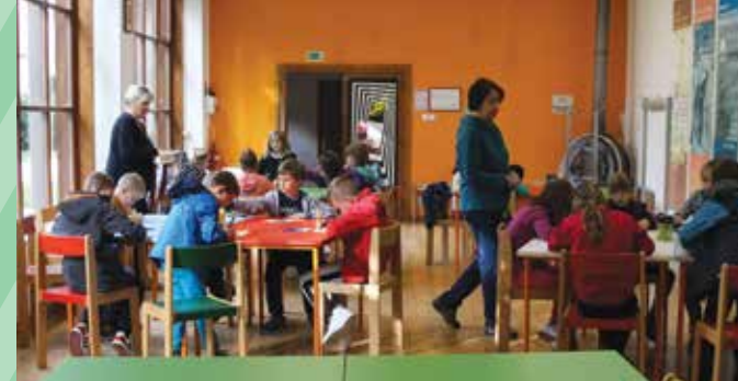
Delavnica v Tehniškem muzeju Slovenije v Bistri