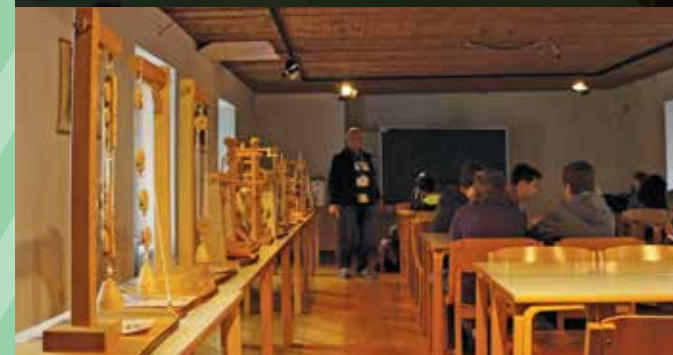
Prikaz Jurij Vega v Tehniškem muzeju Slovenije v Bistri