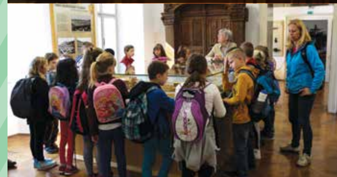
Vodeni ogled v Tehniškem muzeju Slovenije v Bistri