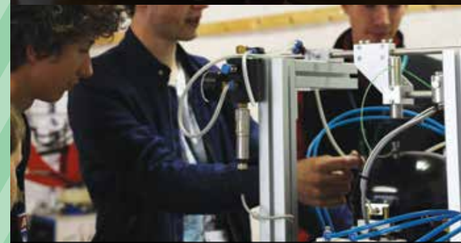
DiŽiT v Tehniškem muzeju Slovenije v Bistri